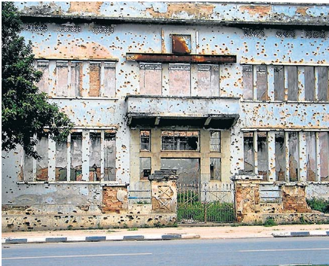
Façana d'un edifici d'Angola amb tots els impactes de bala de la guerra civil.

Benchimol, un periodista especialitzat en desaparicions: "En aquest país tot desapareix. Potser és que el país sencer és en vies de desaparèixer". Pobles petits, diamants, avions sencers, escriptors amb mala sort. ¿És màgia negra o són les noves màfies sorgides després de la fi de la guerra en un país sense control, que proven de silenciar els periodistes massa curiosos? La novel·la no és només sobre la guerra, sinó sobre el després dels conflictes: "El sistema capitalista, que allà, a Angola, prosperant com el verdet entre la runa, ho anava podrint tot, ho corrompia tot". Quan acaba un conflicte a qualsevol racó del món, hi ha uns depredadors que són els primers que ensumen el negoci. I sota una disfressa de promotors i emprenedors d'un futur net i clar, edifiquen imperis en forma de gratacels de vidre sobre piles d'ossos sense identificar. També és aquest oblit el que denuncia Agualusa.