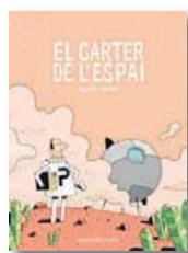
El carter de l'espai GUILLAUME PERREAULT Joventut

Pedrolo escrivia i escrivia, per a ell, però també per salvar els mots. Escrivia i, moltes vegades, no el publicaven. Els lapsos de temps entre creació i publicació sovint anaven lligats amb la censura. D'altres vegades no. Es tractava, simplement, de criteri editorial. Pedrolo, amb el seu íntim compromís per la llibertat, demostrava, amb les penúries i problemes que comportava (incloent-hi els judicials) que, efectivament, la literatura és una manera d'estar en el món i d'entendre'l. L'obra de Pedrolo és de qualitat desigual, el seu compromís va ser i és de pedra picada. Per sort per a tots nosaltres. ♦♦