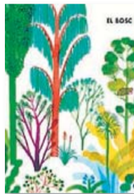
EL BOSCO RICCARDO BOZZI, VALERIO VIDALI I VIOLETA LÓPIZ MILRAZONES TRAD. JÚLIA BAS 64 PÀG. / 25 €

Els caminants –disculpeu la filtració– arriben a l'últim tram del bosc: és quan han d'escalar una muntanya costeruda fins a assolir el cim, una ascensió que s'acaba amb una imatge punyent de la mort. Per la complexitat del conjunt en la forma i el contingut –que s'entengui en el bon sentit–, fàcilment ens plantejarem quin pot ser el públic adequat per a una obra d'aquestes característiques. Cal pensar que alguns textos tenen diversos nivells de lectura. En aquest sentit, és possible que ens trobem davant d'un llibre il·lustrat crossover pel que fa a la franja d'edat; ens referim a aquells que no sols poden llegir els infants, sinó que també interessin als adults. I sense fer escarafalls hem de recordar que els nens estan preparats per entendre qüestions transcendents i nosaltres, els grans, ho estem per gaudir amb àlbums tradicionalment pensats per als petits. ♦♦