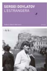
L'ESTRANGERA SERGUEI DOVLÀTOV LABREU TRADUCCIÓ DE MIQUEL CABAL GUARRO 150 PÀG. / 16 €

S'ha dit molt que les novel·les de Dovlàtov semblen poemes llargs, en què l'argument és només una excusa i la gràcia resideix en petits detalls fulgurants o en comparacions eficaces. N'és l'exemple més patent L'estrangera , el primer llibre que l'autor situa als Estats Units, publicat el 1986. Al centre de l'acció hi ha la Marússia Tataróvitx, una noia de trenta-quatre anys que deixa el seu Moscou natal i marxa a Amèrica per refer la seva vida, i en Rafael, un llatinoamericà que la Marússia coneix a Nova York i que als ulls de tothom és un drogo somiatruïtes. El narrador descriu així l'inici de la seva relació: "Al principi, per a la Marússia en Rafael era el carrer, una peculiaritat del paisatge. Un element més d'un lloc concret, com ho eren els aparadors de la casa Rainbow, l'olor de les fregidores gregues o la veu ronca de l'Adriano Celentano". Al cap de vint pàgines, quan la Marússia i en Rafael ja porten un temps vivint junts i ell comet un acte sumament irresponsable, ella li clava una bufetada. "Va sonar com si mil