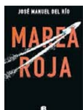
Marea roja. JOSÉ MANUEL DEL RÍO. Ediciones B

Coincidint amb la marea vermella que va tenyir les aigües gallegues el 2000, un narcotraficant surt de la presó després de vuit anys. El seu imperi de la droga queda enterrat i l'únic que vol és portar una vida normal, cosa difícil després d'aquest buit temporal i el renom que arrossega.