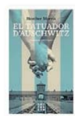
El tatuador d'Auschwitz. HEATHER MORRIS. Amsterdam

Heather Morris ha esperat a la mort dels protagonistes de la novel·la per presentar aquesta història real d'amor i superació: la de dos supervivents de l'Holocaust que s'enamoren en un infern. Els esforços de tots dos per subsistir són durs, però setanta anys després encara segueixen junts.