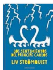
Los sentimientos... LIV STRÖMQUIST. Reservoir Books

La vinyetista Liv Strömquist prova d'entendre i desmuntar l'amor romàntic en aquest assaig visual, que recorre la història del concepte de l'amor fent un repàs dels personatges mediàtics i com la seva masculinitat ha sigut un model a seguir. Una forta crítica que ve carregada d'humor.