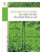
La vida i els fets d'en... J.M. FOLCH I TORRES Adesiara

Aquesta novel·la de Josep Maria Folch i Torres tracta de l'amor, de la superació de la pèrdua, dels primers amors, de lluites, de justícia, de desig i de sacrifici. La novel·la ressegueix l'amor entre en Justí i la Lluïsa de Marival en el context de la França revolucionària, de la guillotina i dels grans ideals.