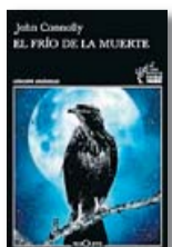
El frío de la muerte JOHN CONNOLLY Tusquets

Aquesta nova aventura del protagonista Charlie Parker és ja la quinzena publicada per Tusquets Editors. En aquesta ocasió Charlie haurà de localitzar al desaparegut detectiu privat, Jaycob Eklund, per ordres especials de Edgar Ross, agent especial de l'FBI.