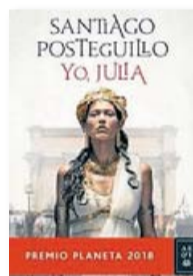
YO, JULIA SANTIAGO POSTEGUILLO PLANETA 704 PÀG. / 22,90 €

Al final, llegir tot açò és com menjar quinoa: s'empassa amb rapidesa, no ompli l'estómac i, al poc d'haver dinat, ja tornes a tindre fam... ♦♦