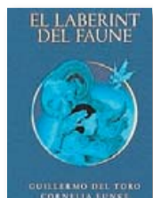
El laberint del faune G. DEL TORO / C. FUNKE / Bromera

El director, productor i guionista mexicà i la reconeguda escriptora de literatura juvenil en el gènere de la fantasia uneixen les seves veus en aquesta adaptació de la pel·lícula del mateix nom, El laberint del faune , una història en què el dolor, la bellesa, el possible i l'impossible es donen la mà.