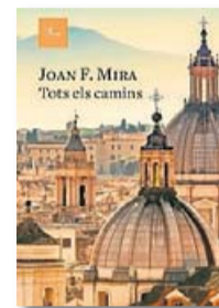
TOTS ELS CAMINS JOAN F. MIRA PROA 384 PÀG. / 19,50 €

Tots els camins és, en gran part, la crònica sumària de la peripècia de l'autor pels diferents centres on els atzars celestials el van portar: primer Iecla, a Múrcia, després el monestir d'Iratxe, a Navarra, i finalment la Universitat Gregoriana de Roma. El xaval que, als 14 anys, descobreix gràcies als seus mestres la llengua grega i un projecte personal de santedat és observat, tants anys després, amb la indulgència de la prolecta persona en què s'ha convertit, “si és que un vell agnòstic,