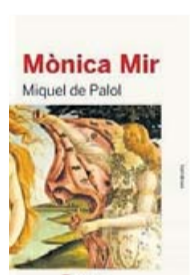
MÒNICA MIR MIQUEL DE PALOL ANGLE EDITORIAL 480 PÀG. / 20,90 €

Els Solidararis Transversals són “les escorrialles del moviment 15-M”, diu Palol. “En el moment en què es