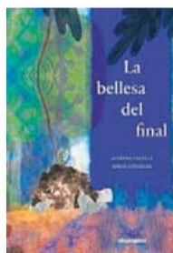
LA BELLESA DEL FINAL ALFREDO COLELLA I JORGE GONZÁLEZ A BUEN PASO TRAD. BERNAT CORMAND 52 PÀG. / 16 €

I, d'altra banda, si perdem algú pròxim, encara que hi hagi dolor valorarem el llegat que deixen les persones que se'n van (o la vida plena que han tingut) com un no morir. La Nina, a qui també fa respecte arribar a l'última pàgina, quan ho fa es limita a arraulir-se a la claror de la lluna plena. I és aquí on el llibre que tenim a les mans, com totes les coses, també s'acaba, i el més bonic és que ara en podeu començar un altre, perquè aquesta és la bellesa del final. ♦♦