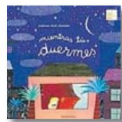
Mientras tú duermes MARIANA RUIZ JOHNSON Kalandraka

Gràcies a aquest recull de vuit històries, algunes més conegudes que d'altres, tenim l'oportunitat de llegir les clàssiques faules d'Isop. Es tracta d'un llibre amb uns textos molt ben recuperats i revisats per la jove autora britànica Elli Woollard, i molt ben dibuixats per Marta Altés, de qui coneixem i reconeixem el treball com a il·lustradora infantil.