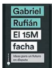
El 15M facha GABRIEL RUFÍAN Temas de hoy

"Quan el feixisme qinterpel·la la classe obrera, guanya. I això és el que està passant ara". Amb aquestes contundents paraules s'expressa Gabriel Rufián en l'opuscle El 15M facha , on fa una proposta de futur basada en la defensa de les polítiques socials i de l'esfera pública.