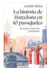
La història de Barcelona... JAUME GRAU Rosa dels vents

Les deu rutes temàtiques que proposa Jaume Grau per recórrer Barcelona es poden fer caminant. Des de la ruta de l'aigua, de les revoltes, de les guerres o de les epidèmies fins a la ruta del treball, de les obres i de l'especulació o de la Barcelona màgica, l'autor ens convida a mirar-la a través de la història.