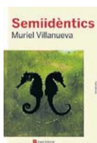
SEMIIDÈNTICS MURIEL VILLANUEVA ANGLE 190 PÀG. / 16,90 €

L'Ari i l'Aran descobreixen l'existència de l'altre però conviuen amb una sensació de buit que no aconseguen esvaïr. Ella és una rapera barcelonina de moda –els versos