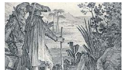
El Candide de Voltaire. VIQUIPEDIA

Però no les diu d'Espanya en general: "És la més orgullosa de les nacions i la que té menys motius per ser-ho, llevat que les qualitats monacals -la beateria, la mandra i la brutícia- siguin títols per enorgullir-se. En qualsevol cas, a aquest poble altiu i soberg no se li pot negar una gran bravura; però seria bo que el temperés la humanitat". Després parla de les atrocitats cometes pels espanyols en nom del catolicisme, a les terres americanes, però això no és cap novetat per a nosaltres.