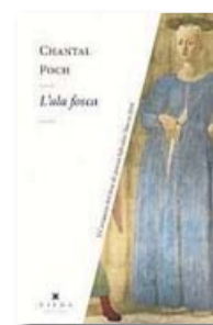
L'ALA FOSCA CHANTAL POCH VIENA 96 PÀG. / 12 €

Aquest és el viatge que ens proposa la poeta, iniciat per un jo poètic incapaç de comunicar-se –com Kaspar Hauser, l'adolescent alemany que havia viscut tota la vida reclòs en una cel·la– i ens porta cap al reconeixement d'un mateix dins d'un nosaltres perquè “cada generació / ha dut aquesta”. A la segona part, el subjecte conforma col·lectius com la família i es deixa regir per les tradicions, però continua sent incapaç de dir: “voldria dur un nom a la boca / com un colom daurat”. No és