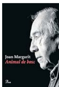
ANIMAL DE BOSCA JOAN MARGARIT PROA 104 PÀG. / 15,50 €