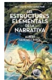
LES ESTRUCTURES ELEMENTALS DE LA NARRATIVA ALBERT SÁNCHEZ PIÑOL LA CAMPANA 208 PÀG. / 19,90 €

L'auge de les escoles d'escriptura creativa coincideix amb la publicació de diversos llibres que aborden el fet literari, com els d'Albert Sánchez Piñol, Annie Dillard i Vicenç Pagès Jordà. On acaba la feina a l'aula i on comença el talent personal?