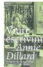
VIURE ESCRIVINT ANNIE DILLARD L'ALTRA EDITORIAL TRAD. ALBA DEDEU 148 PÀG. / 16 €