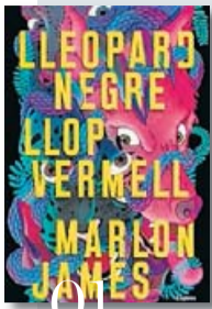
01 LLEOPARD NEGRE, LLOP VERMELL MARLON JAMES EMPÚRIES