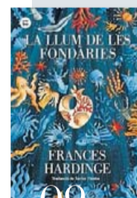
09 LA LLUM DE LES FONDÀRIES FRANCES HARDINGE BAMBÚ