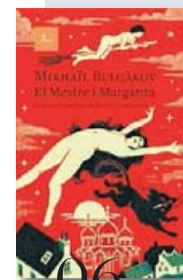
06 EL MESTRE I MARGARITA MIKHAÏL BULGÀKOV PROA

també explora la il·lusió d'aquella persona que coneix quin és el seu destí i ofici i ha arribat al lloc, en aquest cas la universitat, on podrà sentir-se realitzada. Per acabar, parla de la ingenuïtat de l'amor i de la sexualitat viscuda des d'un camí per fer. La novel·la s'equilibra magistralment gràcies al coneixement que ens transmet Bonet del món de la pintura i de la creació artística. Es tracta d'un relat valent en què constatem com pot ser de fràgil i vulnerable la vida d'una persona sota l'ombra d'aquell que la vol modelar i manipular des de l'egoisme de l'abús".