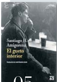
05 EL GUETO INTERIOR SANTIAGO H. AMIGORENA EDICIONS 62