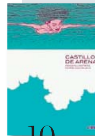
10 CASTILLO DE ARENA P.O. LÉVY I.F. PEETERS ASTIBERRI