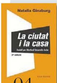
04 LA CIUTAT I LA CASA NATALIA GINZBURG CLUB EDITOR