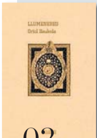
02 LLUMENERES ORIO SAULEDA DOCUMENTS DOCUMENTA