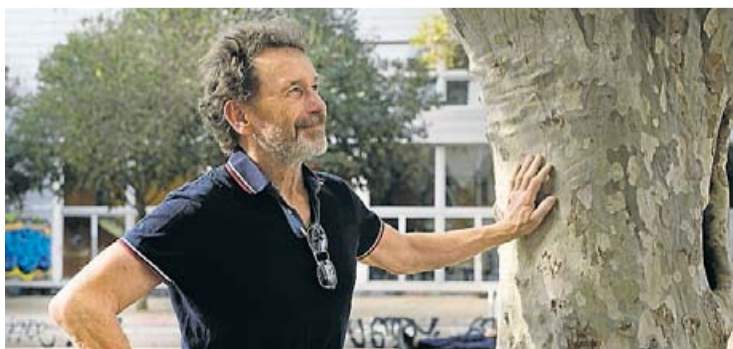
L'escriptor noruec Per Petterson a Barcelona.