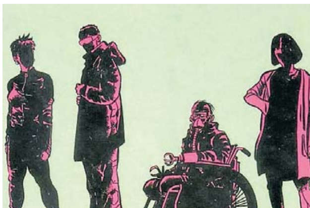
Il·lustració de Luis Bustos. LUIS BUSTOS / GIGAMESH

Aquest llibre ens parla de com els monstres volen convertir-nos en monstres a imatge i semblança seva, com si fossin déus. I de com l'ésser humà es rebel·la contra qualsevol poder extrahumà. I així, és quan més monstres ens creiem que veritablement som de carn i ossos. I també ens diu aquest llibre que no hi ha cap mena de teràpia per als boomers. ☞