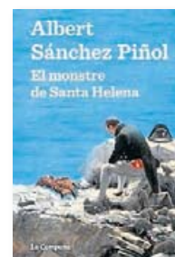
EL MONSTRE DE SANTA HELENA ALBERT SÁNCHEZ PIÑOL LA CAMPANA 302 PÀG. / 19,90 €

Quan pot, el poder fa fora la cultura i viola la bellesa.