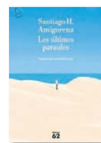
LES ÚLTIMES PARAULES SANTIAGO H. AMIGORENA EDICIONS 62 / RANDOM HOUSE TRAD. JORDI MARTÍN LLORET 152 PÀG./15,90 €

“El més terrible és pensar que el futur serà terrible i que no hi serem per als nostres fills. Sentim que estem a prop del final, i per això tot el que fem és tan suïcida. Però nosaltres no viurem el final del món, el viuran les dues o tres generacions següents”, afirma. Des del seu punt de vista, el declivi de les persones ja ha començat, i és palpable amb esdeveniments recents com la pandèmia i la guerra a Europa. “Estem vivint la fi d'una forma d'humanitat, però estic convençut que l'ésser humà pot ressorgir davant de qualsevol cosa –subratlla l'escriptor–. Veig aquest final amb optimisme, i de la mateixa manera ho transmeto al llibre”.