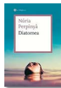
DIATOMEA NÚRIA PERPINYÀ LAMAGRANA 336 PÀG./19,90 €

mar i peatges i autopistes als oceans. “Un dels problemes actuals és la privatització dels recursos naturals. El capitalisme encara està al començament, veurem coses pitjors”, pronostica l'escriptora, sense deixar-se endur del tot per les idees més fosques: “Ho veig amb pessimisme, però confio que se solucionaran les coses. Lluitant, evidentment”.