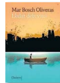
L'EDAT DELS VIUS MARBOSCH OLIVERAS UNIVERS 176 PÀG./19 €

cè del lector–, la novel·la actua com una eina per reflexionar sobre el present. “Les distopies són un mirall negre que denuncia i evidencia uns fets davant la societat. Poden ser interpretades com un senyal d'avertiment, una manera de dir que potser encara som a temps d'arreglar-ho”, diu. Els mecanismes de control de la població per part dels governs li preocupen, i ho equipara a la síndrome de la granta bullint: “Totes les distopies són una denúncia als totalitarismes. Ens hem de plantejar si no ens adonem que ens estem quedant bullits tots plegats”.