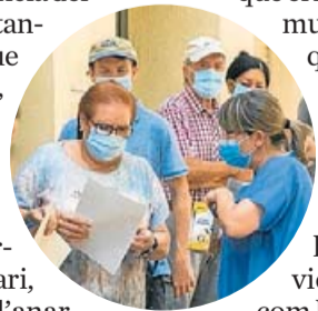
JAVIER PÉREZ ANDÚJAR

filis. La seva en particular. La que el va matar. Ens la fa conèixer des dels primers símptomes (la febre), i fins i tot apunta que el metge li mana al narrador bromur de potassi (que era amb el que es tractava els sífilítics abans que es descobrís la penicil·lina). A la narració també s’hi troben els fantasmes de la culpa, de sentir-se contagiats i transmissors. La seva història (el que li va passar a la vida) Léon Daudet la va definir com la més tràgica de les lluites internes. Sabia de què parlava. El seu pare, Alphonse Daudet, el creador de Tartarí de Tarascó, va morir d’allò mateix. Avui es fa un altre tipus de terror. Hem canviat la malaltia per les pandèmies i la persona malalta per l’estadística.