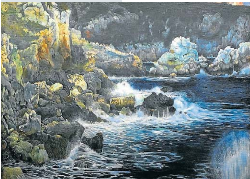
'LA CALA ENCANTADA', UN QUADRE DE JOAQUIM MIR.

A 'L'ART DE LA PINTURA' GABRIEL FERRATER ESCRIU UNA PROSA ANALÍTICA I ALHORA CARNAL PLENA DE TEORIES PERÒ TAMBÉ DE SENSIBILITAT