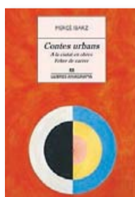
CONTES URBANS MERCÈ IBARZ ANAGRAMA 200 PÀG. / 19,90 €

La literatura és plena de personatges femenins que passegen pels carrers de la seva ciutat o d'alguna altra on són mers visitants. La se-