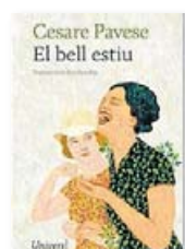
El bell estiu CESARE PAVESE Univers

Univers incorpora al catàleg El bell estiu , un dels títols més emblemàtics de Cesare Pavese. La novel·la relata la relació apassionada i tempestuosa entre la Ginia, una jove innocent amb ànsies desbocades de vida, i un pintor enigmàtic i bohemí que li farà descobrir les crueltats de l'amor.