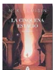
La cinquena estació N. K. JEMISIN Mai Més Llibres

N.K. Jemisin és un dels noms de referència de la ciència-ficció i la fantasia contemporànies. Ara Mai Més publica el primer títol de la trilogia La terra fragmentada , una història plena de girs argumentals ambientada en un supercontinent que pateix catàstrofes geològiques i climàtiques.