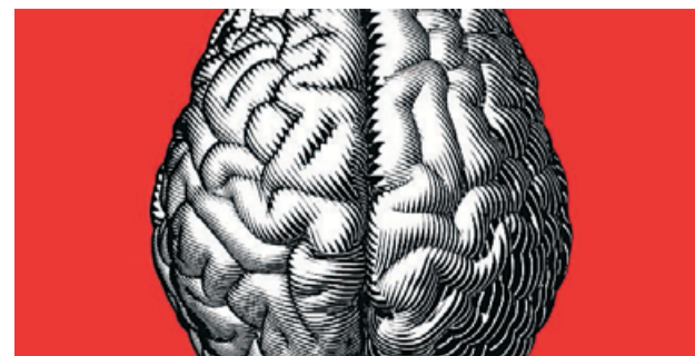
Detall d’un cervell.

Encara que el principal esforç de Pinker sigui alliberar-nos, d’una vegada, de la postmodernitat (del relativisme), s’hi troba atrapat per a sempre en la major i pòstuma creació d’aquesta. Apareix com a personatge real acompanyant els protagonistes de la novel·la de David Foster Wallace La broma infinita (Debolsillo, 2021). ✍