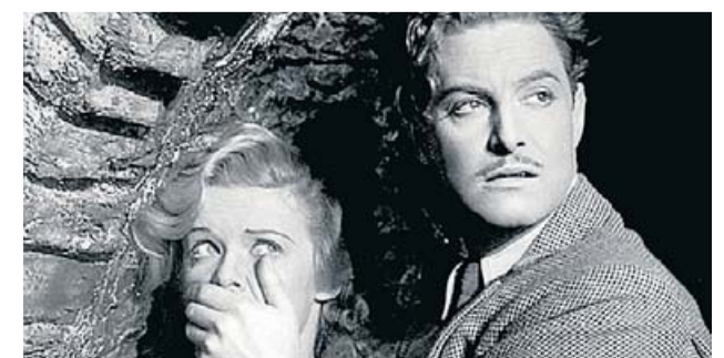
Hitchcock va adaptar Els 39 esglaons . GAUMONT