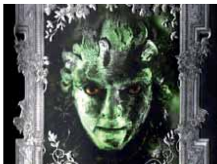
Detall de la coberta de 'Reckless'.

d'exemplars i també va arribar als cinemes. Ara proposa creuar el mirall de la mà dels germans Will i Jacob Reckless. El primer, més petit, és prudent; el segon, el gran, més aviat temerari, i no dubta a travessar el portal, esperonat per l'ansia de conèixer per què va desaparèixer el seu pare. Però en Jacob comet un error. El seu germà el segueix al món del mirall i es veurà afectat per la maledicció de la carn de pedra. I en Jacob haurà de trobar la manera de curar-lo per salvar-li la vida, afrontant tota me-