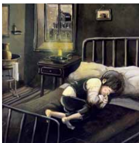
D'esquerra a dreta i de dalt a baix: 1. Il·lustració de Benjamin Lacombe per a 'Contes silenciosos', publicat per Editorial Baula; 2. Il·lustració de Rebeca Luciani per a 'La Negrité malsons', publicat per La Galera; 3. Il·lustració de Batia Kolton per a 'La cadena daurada', publicat per Editorial Alrevés; 4. Il·lustració de Carles Arbat per a 'Tres contes de Nadal', publicat per Baula; 5. Il·lustració d'Olga Lecaye per a 'Conills, somriures i companyia', publicat per Editorial Corimbo

bricació literària fomentada pels mateixos que ara no saben com ressituar-la.