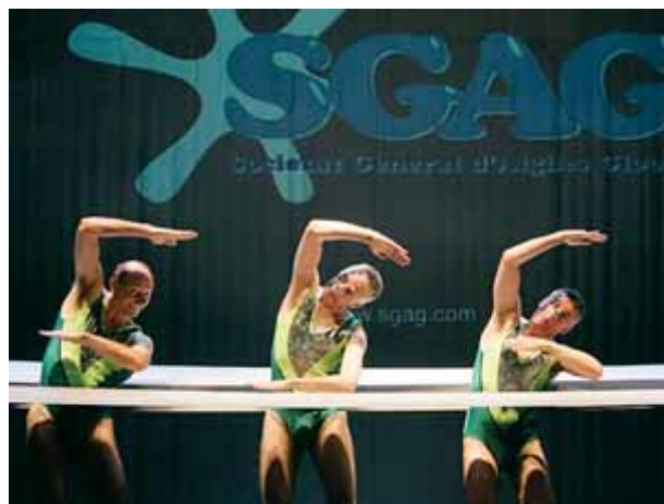
'Flirt' de Guillem Albà amb la Marching Band, a la imatge superior. A sota, una escena d'"El mètode Grönholm", que s'acomia al Poliorama, i el gag de natació sincronitzada de Vol-Ras a 'Sgag'

tot i que no sigui per a canalla. Plecs és un treball original, subtil, que atrapa per la recerca més que pels salts mortals, tot i no abandonar l'acrobàcia. Un sisè circ és el d'Alex Zavatta, que s'estarà fins al 9 de gener al parc de Can Dragó. Aquest circ familiar repeteix Nadal a la Meridiana.