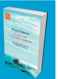
L'illa de l'última veritat

Un dels mèrits de Company és que aconsegueix fer creïble l'ambient opressiu i exasperant de la situació -aprensió