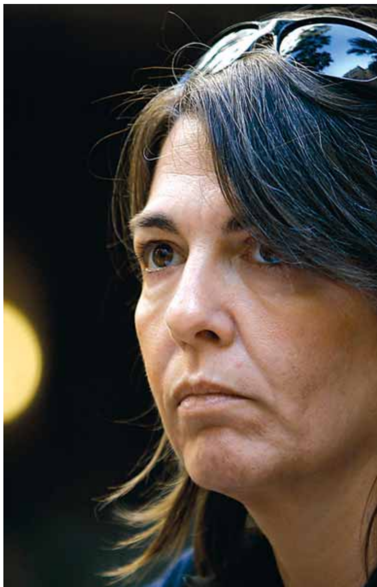
Flavia Company ha publicat una novel·la d'intriga claustrofòbica

Company s'ha esforçat a ser literàriament honesta -va deixant moltes pistes de l'engany que perpetra-, però el joc de veus narradores a partir del qual ens explica la història -punts de vista i informacions de què disposen- no és coherent amb el desenllaç final. I el lector sent que se l'han rifat. Això no vol dir -compte que L'illa de l'última veritat no sigui una bona novel·la. Ho és. Entretinguda i intel·ligent.*