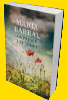
La pressa del temps

En els vint-i-set contes que componen La pressa del temps hi ha, en efecte, una inalterable serenitat, malgrat que s'hi esdevenen fets que, amb tota senzillesa, aporten el mal ben concret allà on hi havia una situació presentada com a estable i raonablement feliç. Amb mà segura, l'autora evita (o almenys no en treu partit) el fatalisme. Tanmateix, el món del llibre té una unitat de fons que, més ençà o més enllà, es correspon amb una realitat de tres caires: ciutadana