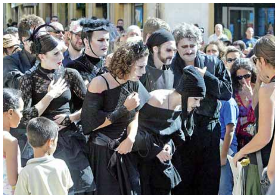
Els actors d'Ens de Nos, gòtics, barrejats entre el públic a la plaça Major ■ JUANMA RAMOS

Música en directe i acrobàcia són els elements d'A tempo. L'obra, que estarà en el cartell de la Mercè de Barcelona, ja fa un any que roda. Sense una dramaturgia que ho empantanegui, se succeeixen els números amb efectivitat. Els personatges de Kamchatka, que enguany s'han vist ocupant una casa ocupada, agraiats i acollidors, responen a un model de teatre de carrer: el treball de companyia, amb personatges estraforaris