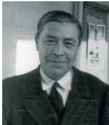
Pla va viatjar a l'URSS