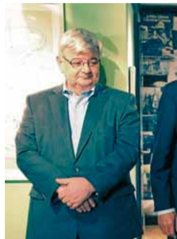
Joschka Fischer va ser ministre alemany d'Afers Estrangers

Claritanes. Ara bé, si el pla de Fischer tira endavant, caldria que els països europeus anòmals, o sigui, sense representació pròpia (repetim la lletania: Flandes, Escòcia, Catalunya i Euskadi), s'espavilessin si volen participar-hi. La primera a fer-ho, segurament, serà Escòcia: el referèndum que permetrà que els escocesos votin a favor d'un país independent (o com a mínim l'equivalent escocès del règim foral)