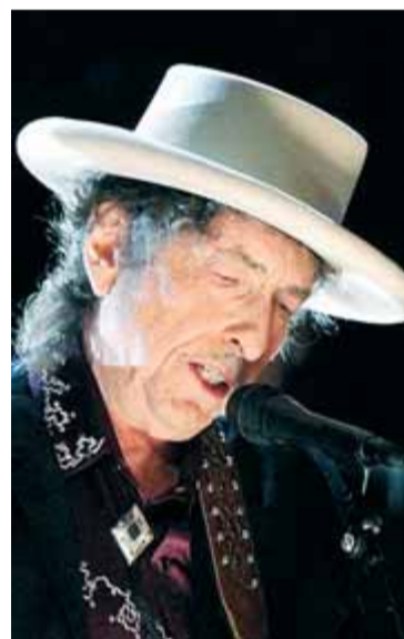
Bob Dylan va fer 70 anys dimarts passat

Dylan. Que la gent que encara no pot suportar Dylan –com no el podia suportar jo durant tant de temps– em perdoni per recomanar-li tres cançons, tres, que potser podrien fer-li canviar de parer. Subteranean home-