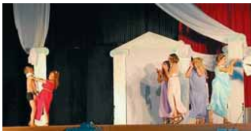
Una escena de la mostra de l'any passat.

El circuit de teatre amateur del Segrià Vesprades de Teatre inicia aquest cap de setmana una altra edició, la vuitena. L'estrena és a Alcanó aquest dissabte 3 de novembre. És el primer de 13 municipis de la comarca que seran la seu, durant els mesos de novembre i desembre, d'alguna de les obres escollides en el cicle i ofereixen