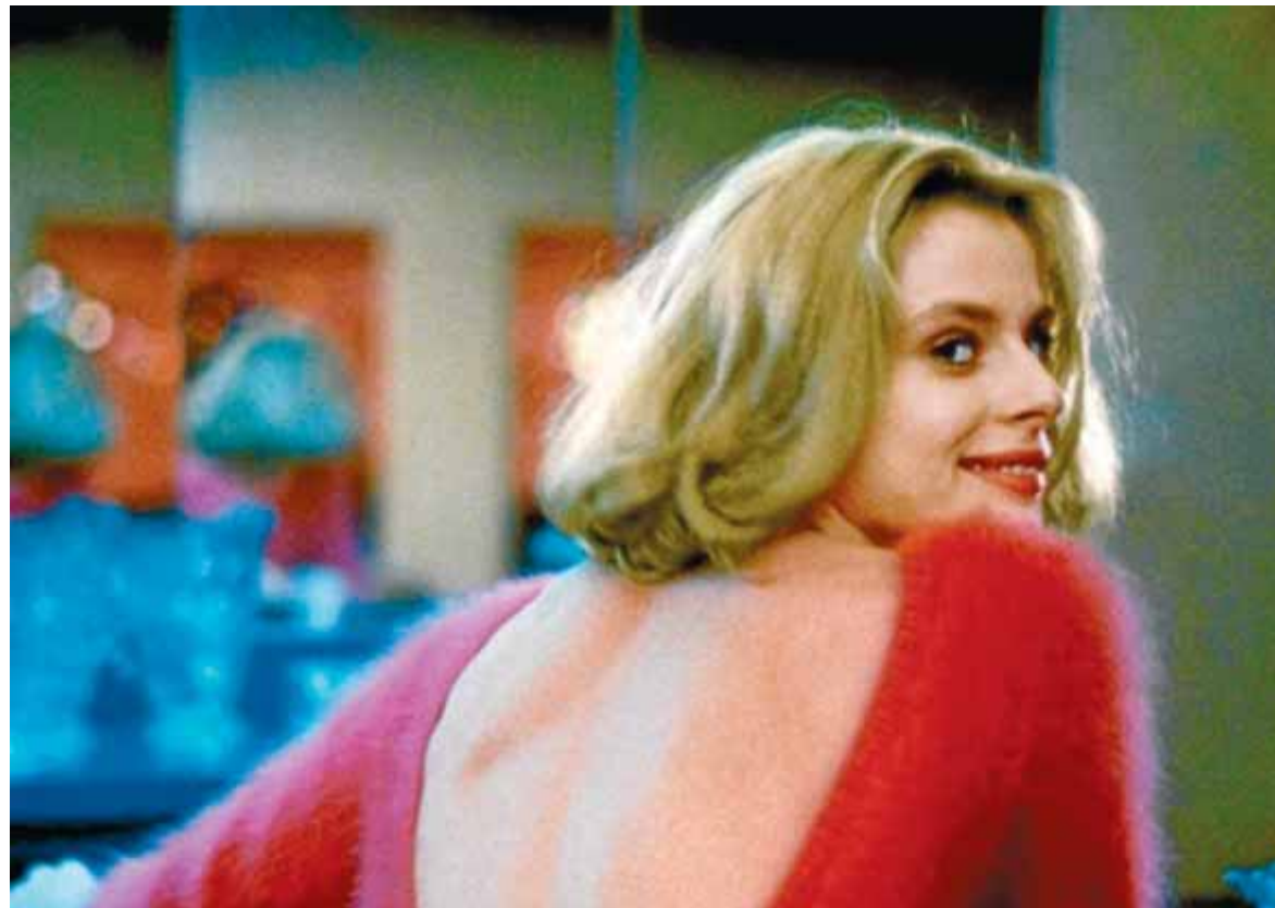
Una insuperable Nastassja Kinski va protagonitzar 'Paris, Texas' de Wim Wenders