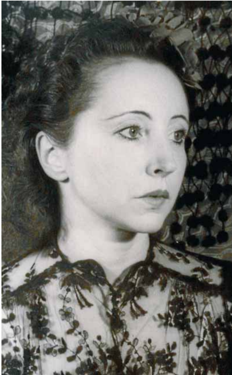
Anaïs Nin va escriure diaris, novel·les i narracions