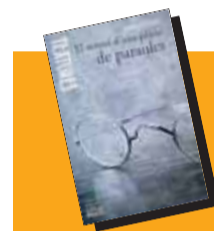
El somni d'una pàtria de paraules Autor: Josep Piera Editorial: Bromera Alzira, 2012 Pàgines: 308 Preu: 19,95 euros

El somni d'una pàtria de paraules és un llibre ple de vida, on l'autor evoca una extensa galeria de personatges i tot un sistema social i cultural. Piera ens fa reviure la València a cavall de dos segles, el XIX i el XX, des de l'òptica llorentiana. El llibre també està carregat de coneixement, coneixement de dos tipus: documental i literari. És portentosa la quantitat de documentació de l'època que Piera calladament incrusta al seu text. I, per una altra banda, és formidable la capacitat exegètica de Piera a l'hora de llegir i reavaluar l'obra de Llorente, demostrant-ne la seva peculiar vocació de modernitat. *