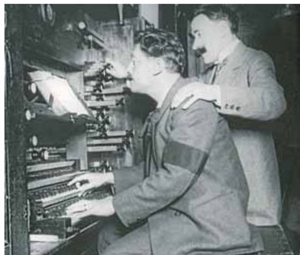
Déodat de Séverac, a la dreta, i el pianista Ricard Viñes, en una fotografia d'arxiu

Va ser a la Schola Cantorum de París on Séverac va entrar en contacte amb aquest estol de compositors, però també està documentat que va visitar sovint la capital catalana, on va relacionar-se amb