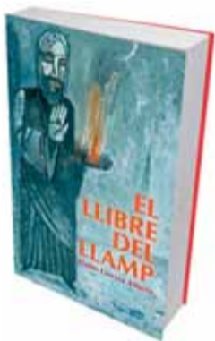
EL LLIBRE DEL LLAMP Quim Garcia Albera

La novel·la històrica i la novel·la negra gaudeixen d'una salut de ferro i els seguidors d'un gènere i l'altre disposen des d'aquest mes a les llibreries d'una nova proposta que reuneix els dos mons: El llibre del llamp , de Quim Garcia Albera (Lleida, 1966). La novel·la, editada per Pagès Editors, està ambientada a la Lleida del segle XIII, durant la construcció de la monumental catedral de la Seu Vella. A la Cuirassa, el barri hebreu de la ciutat, es produeixen una sèrie de raptos de nenes jueves que apareixen després assassinades. Els actes semblen regits pels secrets de la càbala i l'alquímia. Galceran de Chia, un ballester que havia estat al servei de Jaume I, i un metge jueu que ha estat expulsat del call de Toledo, Leví Ben Yehiel, són els encarregats de resoldre el misteri i aturar els assassinats, amb l'ajuda d'un savi ancià local, Ramon de Larida. Tota una immersió intrigant, doncs, en la Catalunya medieval i en una ciutat, Lleida, que vivia en aquella època un període econòmic d'esplendor i una posició clau en la geopolítica de la corona catalano-aragonesa. Quim Garcia Albera ja s'havia endinsat anteriorment en la novel·la històrica – El caballero insomne (2008), en castellà, i El mur d'Indíbil (2009), en català– i és coautor de la novel·la negra La virgen de los sicarios (2005). És professor a l'INS Joan Oró de Lleida i també ha publicat quatre treballs discogràfics com a cantautor.