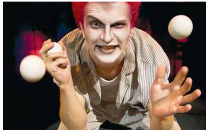
Circ i 'gore'. 'Manicomio de los horrores'. DYP

Lloc i dies: A La Seca, fins al 10 de novembre.