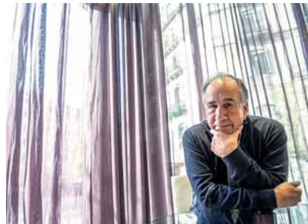
Joan Margarit, poeta d'honor del festival.

“En aquests moments la poesia té un sentit especial. Estem vivint una desfeta de l'estat del benestar. El terme 'benestar' em posa molt nerviós: què vol dir? Els humans som uns personatges, una espècie, que venim de molt lluny. Posem per cas fa cent mil anys... Aleshores ja hi havia persones que si els mataven un fill patien. Si alguna cosa hem après amb el temps és a gestionar la necessitat. En canvi, hi ha una cosa que no sabem gestionar: l'opulència. La primera vegada que hem vist opulència ha estat a partir dels anys vuitanta, i en algunes parts del món. Ha estat un desastre.” Així començava la seva intervenció fa uns dies Joan Margarit, durant la presentació del Festival de Poesia de Sant Cugat. El seu discurs, però, no s'acaba aquí. “Faig un salt endavant... L'opulència només té una gestió possible, i és a través de la cultura. Hem de tornar a saber gestionar la modestia. I la poesia ens pot ajudar més que altres coses. Viure sense cultura i viure dignament només era possible a les societats primitives.” Joan Margarit és el poeta d'honor del Festival de Poesia de Sant Cugat, que comença aquest diumenge. Al llarg de vuit dies, Sant Cugat –i Cerdanyola, que hi col·labora–, serà escenari d'actes diversos, com l'exposició Joan Margarit. Arquitecte de la paraula , o l'espectacle Els meus poetes , amb Emma Vilarasau.