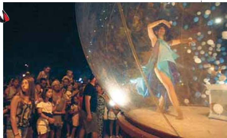
Dins i fora. Els Comediants ja van fer festa al carrer al Festival Porta Ferrada, aquest estiu