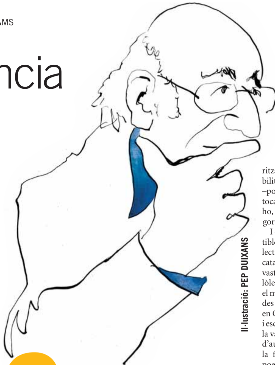
Il·lustració: PEP DUIXANS

Assenyalo Carles Miralles perquè indubtablement la gran aportació d'aquest volum és el