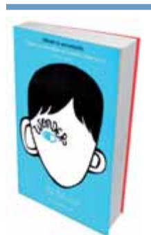
WONDER R.J. Palacio Trad.: Imma Falcó Editorial: La Campana Pàgines: 422 Preu: 14 euros

Nascut a Sabadell el 1934, Formosa escriu dietaris, tradueix i també és home de teatre, però sobretot és un poeta amb 18 poemaris publicats entre el 1973 i el 2009.