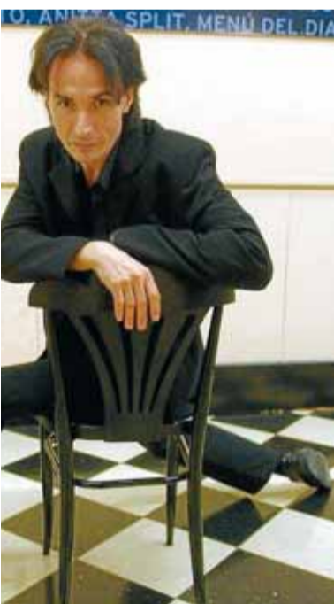
af, en foto d'arxiu EFE/A. OLIVÉ

Àlbum i memòria. De dalt a baix i d'esquerra a dreta, diferents coreografies: Turn me on (2006), Euràsia (2004), La màscara de la mort roja (2000), En clau de jazz , (2008) i Giselle (2010). / CIA. DAVID CAMPOS