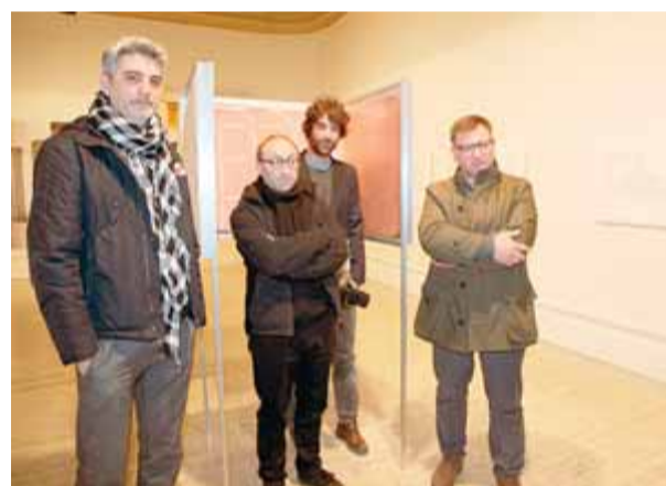
El artistes, reunits al Centre de Lectura de Reus.