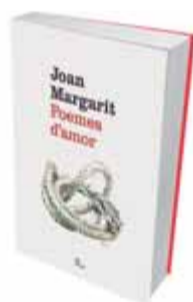
POEMES D'AMOR Joan Margarit Proa

El crític i poeta empordanès publica el cinquè llibre. És el més carnal per la sensualitat que desprèn la trobada entre l'escriptura i allò que anomena, continua explorant les vies de “la fusió entre el paisatge exterior i l'interior”, amb fúria de picapedrer. Espitregat i amb les mànigues arromangades, el poeta es vincla damunt el llenguatge amb el càvec a la mà i en lleva tot el terrós improductiu perquè els poemes no s'enarborin, perquè es lliurin, al contrari, a “l'acte imminent de ser en el desig: el camp des de l'arrel”.