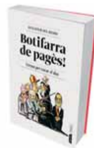
BOTIFARRA DE PAGÈS! Lo Gaiter del Besòs Pòrtic

Poemes d'amor és una aposta i una invitació. És una aposta per destacar els millors poemes d'amor del poeta català actual que més insistentment ha treballat el tema de la poesia amorosa al llarg de la seva carrera. Des dels seus inicis, ja llunyans en el temps, Joan Margarit ha estat el poeta català que d'una manera més constant, complexa i exhaustiva ha explorat l'amor en totes les seves múltiples dimensions, amb totes les seves llums i ombres, amb tota la seva càrrega de felicitat i dramatisme.