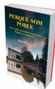
PERQUÈ SOM POBLE Joan Pinyol Imprès a Romanyà Valls