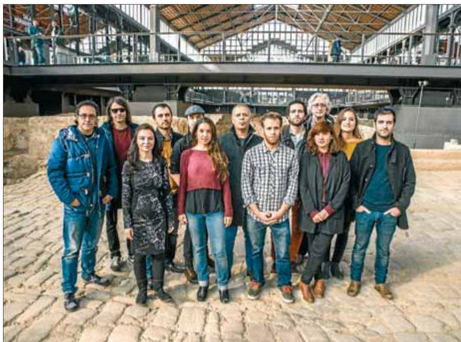
Una part dels músics que participaran en el cicle, ahir al Born Centre Cultural

Lax'n'Busto, un recital amb alguns dels guardonats en el premi Martí i Pol que organitza Lluís Llach, Projecte Mut, El Pont d'Arcalís, Joan Colomo, Roger Mas, Tomeu Penya, Sanjosex, Joana Serrat, David Carabén, Aspencat i Joan Dausà formen un programa que es comple-